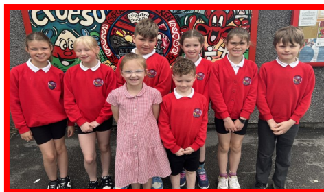
Dreigiau Doeth 2023 –2024