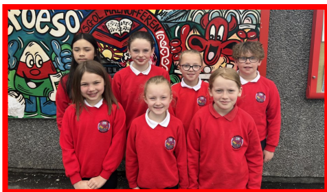
Cyngor Ysgol 2023 –2024