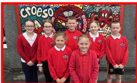
Cyngor Ysgol Iechyd a Lles 2023-2024