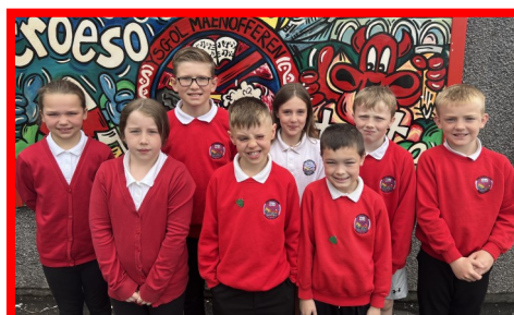
Cyngor Eco 2023 –2024